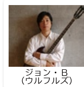
ジョン・B (ウルフルズ)