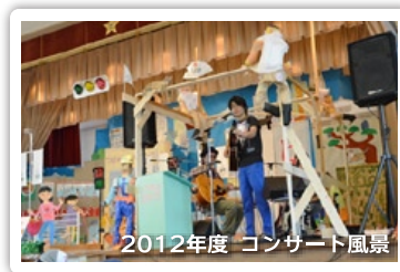
2012年度 コンサート風景

☆来場者が会場収容定員数300人を超えた場合には、入場を制限することがあります。